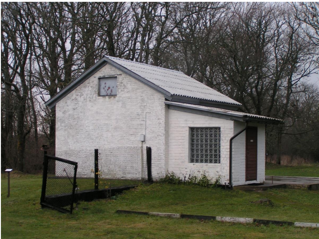
Foto nr 8: Vaade väravamajale kagust. Taustal aimatav 305 mm patarei 4. suurtükipositsioon. Hoone kasutusel Sõrve militaarmuuseumi osana, kohaliku ajaloo väljapanekukohana.