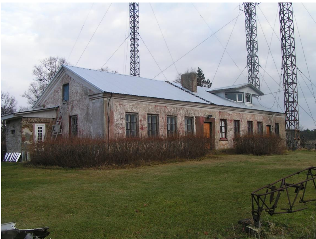
Foto nr 6: Vaade kasarmule edelast. Näha hilisem katuseväljaehitus. Samuti hiljem lisatud kinoputka.