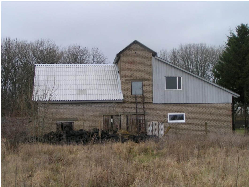
Foto nr 7: Vaade saun-garaaž-katlamajale lõunast. Keskel veepaak. Kasutusel Meremajana.