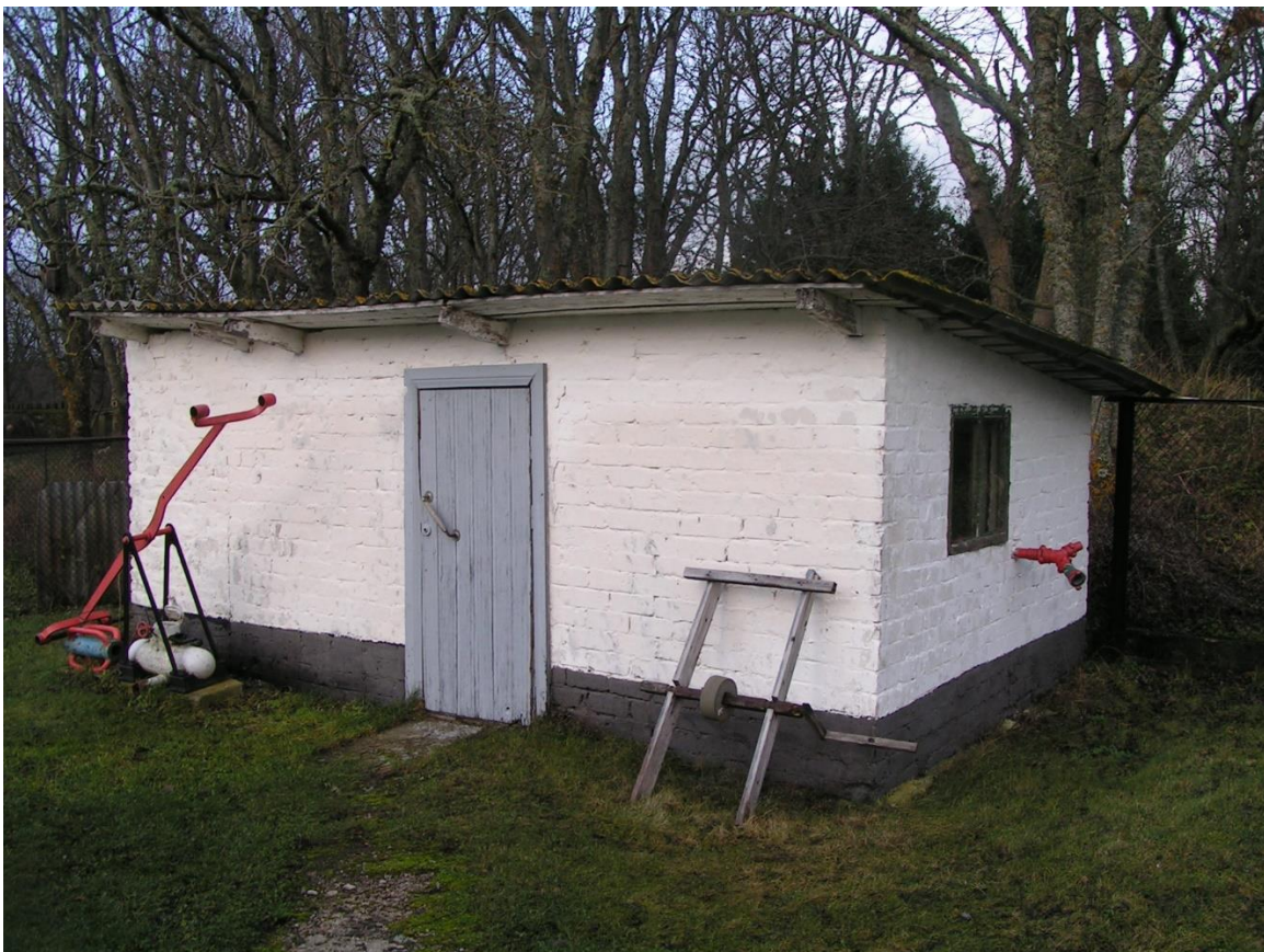
Foto nr 10: Pumbamaja kagust vaadatuna. Lisaks pumbasüsteemile on majas ka salvkaev.