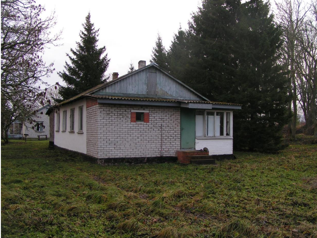
Foto nr 9: Ohvitseride elamu nr. 3 läänest. Taustal elamu nr.2. Hoones on loodusväljapanek. Elamut nr. 2 kasutavad Soome linnuvaatlejad oma keskusena.