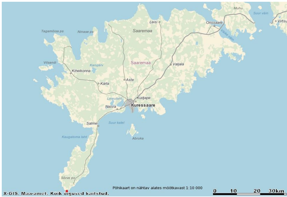
Plaan 1. Säre piirivalvekordoni asukoht Saare maakonnas. Tähistatud punasega.